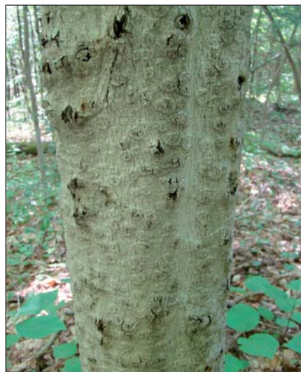
Figure 3. Petits chancres circulaires 1