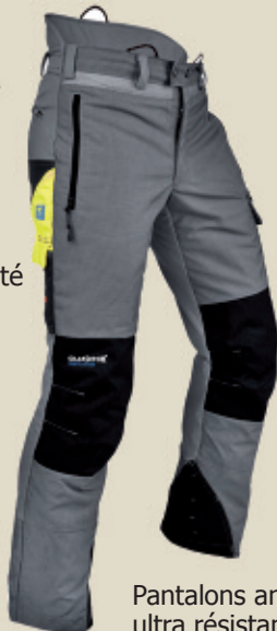
Pantalons anti-coupures ultra résistants et confortables