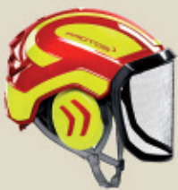
Chapeaux de sécurité pour tous les goûts