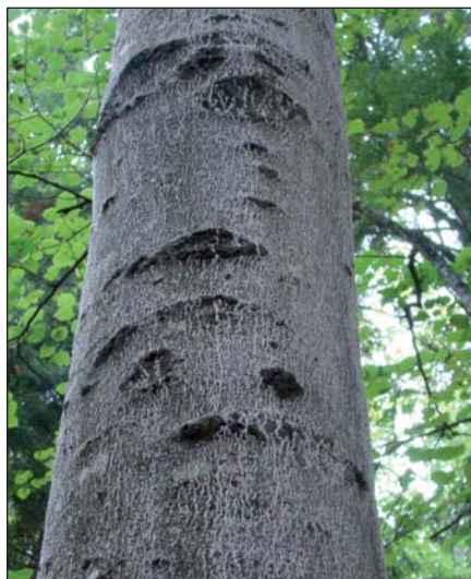
Figure 2. Cire blanche sécrétée par la cochenille du hêtre 1