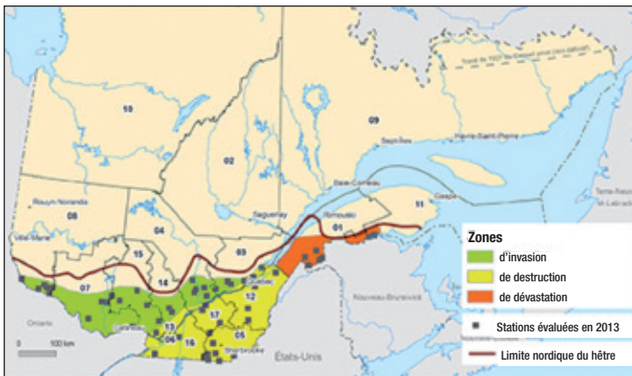
Figure 1. Zones associées aux trois phases de déploiement de la MCH au Québec, à partir de relevés effectués en 2013 dans 54 stations forestières réparties dans 12 régions administratives du Québec méridional. (réf. 1) Depuis la réalisation de cette carte, la présence de la MCH a été détecté dans les municipalités de Ville de Rivière-Rouge, Notre-Dame-du-Laus et même Lac-des-Écorces.

Des relevés effectués en 2013 indiquent la présence de la MCH dans 12 régions administratives du Québec méridional (figure 1). La maladie était alors présente sur le territoire desservi par l'Alliance des propriétaires forestiers Laurentides-Outaouais, soit en Outaouais ainsi que dans le nord des Laurentides. Les études disponibles indiquent que la maladie semble évoluée plus rapidement en Outaouais que dans les autres régions du Québec.