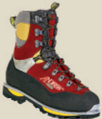
Bottes anti-coupures classe 3