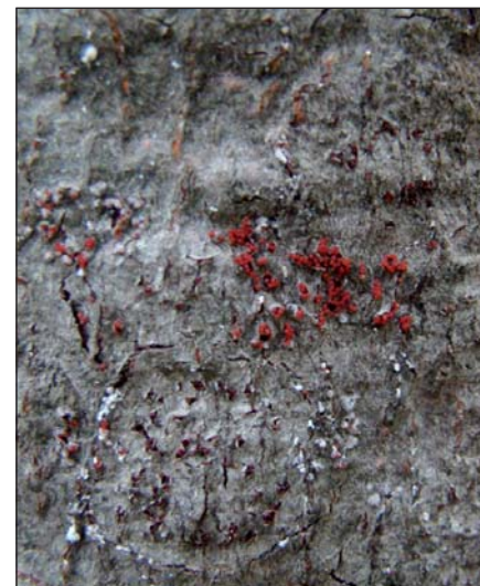
Figure 4. Fructifications de Neonectria à maturité 1

échéance. Les fructifications du champignon se développent sur l'écorce de l'arbre malade 3 à 5 ans après l'invasion par la cochenille. Elles apparaissent sous forme de petites boules rouges orangées. Elles atteignent leur maturité vers la fin de l'été (figure 4).