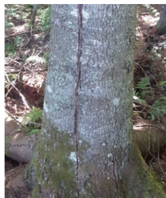
Figure 2. Fente révélant la carie d'un sapin