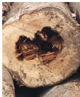
Figure 3. Carie sur billes de sapin