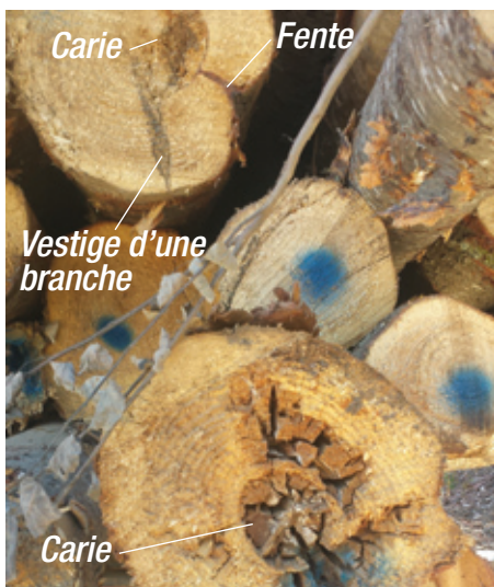
Figure 5. Carie sur billes de sapin

de récolte pour éviter les pertes de bois.