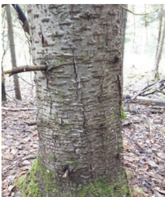
Figure 1. Fissures révélant la carie d'un sapin

Les caries sont provoquées par des champignons qui affectent les fibres du bois et causent leur dégradation (1) (figures 1 à 5). En zone tempérée de la forêt feuillue et mixte, le sapin est affecté fréquemment par les caries du pied qui causent la dégradation des bois, ce qui prédispose le sapin au chablis (2). Lorsqu'il est affecté par la carie, le volume de bois produit annuellement peut être inférieur au volume de bois non dégradé par la carie. On a donc un rendement négatif en termes de production de bois. De plus, les billes de bois trop affectées par la carie sont inutilisables pour les fins de transformation. Pour ces raisons, il est préférable de le récolter lorsqu'il atteint environ soixante ans.