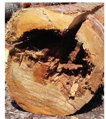
Figure 4. Carie sur billes de sapin